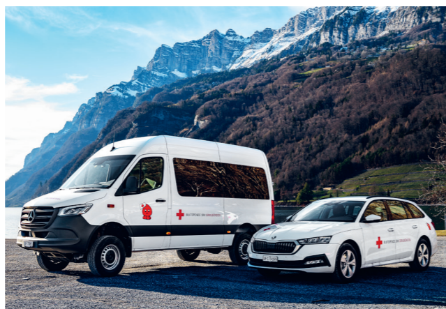
Neue Fahrzeugflotte des Regionalen Blutspendedienstes SRK Graubünden